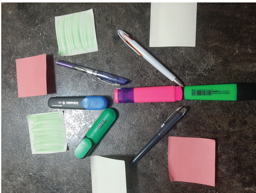
Листки семейного дерева

Таким образом, рассматривая взаимодействие специалистов с замещающей семьей, нам удалось выявить факторы наиболее эффективного взаимодействия; на основе имеющегося опыта работы с замещающими семьями классифицировать возникающие на различных этапах трудности; охарактеризовать универсальную модель психолого-педагогического сопровождения процесса принятия приемного ребенка; представить 3 необходимых этапа работы консультанта и замещающих родителей; выделить правила эффективного взаимодействия в процессе консультаций. Учитывая все вышеперечисленное, были подробно представлены и интерпретированы 5 индивидуальных сценариев взаимодействия специалистов с замещающей семьей по наиболее часто встречающимся и типичным ситуациям.